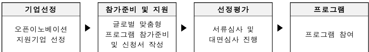
<글로벌 진출을 위한 맞춤형 프로그램 운영 절차>

* 글로벌 진출 맞춤형 프로그램은 본 사업 선정 이후, 별도 선발을 통해서 최종 선정된 경우, 제공 가능(추진 절차 참조)