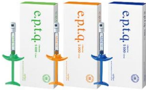
Dermal HA Fillers (e.p.t.q.®)