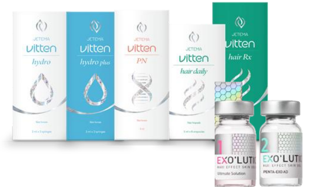
Skin Boosters (vitten® / EXO'LUTION®)

독보적 기술력으로 완성한 메디컬 에스테틱 토털 포트폴리오 자체 원천 기술로 개발한 보툴리눔 독신, 히알루론산 필러, 리프팅 실 등 에스테틱 전 분야 제품군 보유