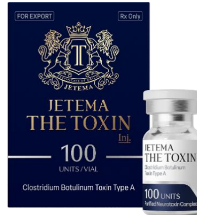
Botulinum Toxin (JETEMA THE TOXIN®)