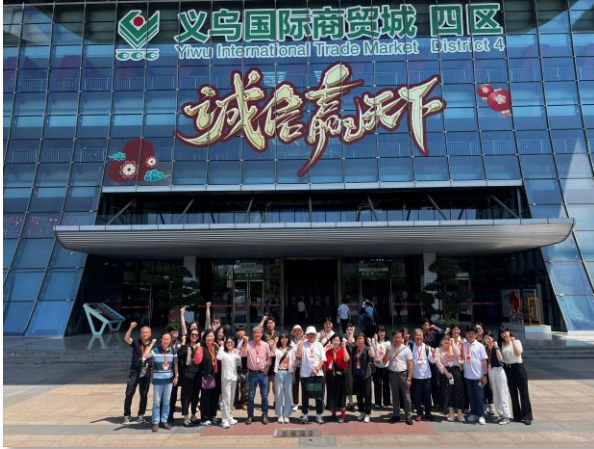
이우 시장 탐방(세계최대 도매시장)