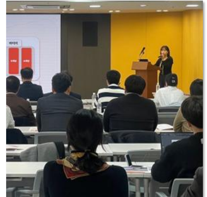
알리바바 닷컴 입점 후속지원