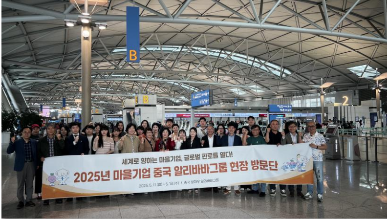
인천공항 집합 및 이동