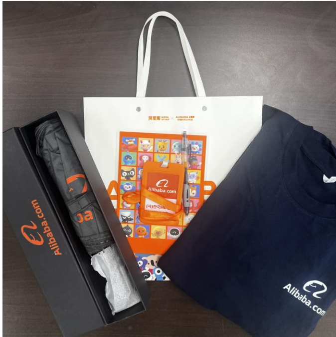
알리바바 웰컴키트 제공

드림트립 전에는 실전 사전 교육을 통해 플랫폼 사용방법에서 수출 실행까지 이어질 수 있도록 체계적으로 지원합니다.