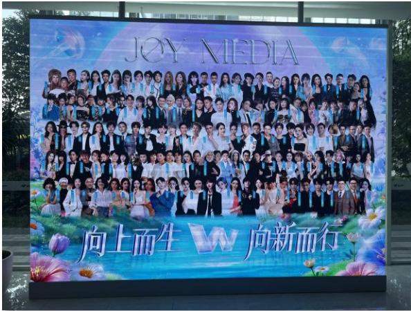
왕홍 스튜디오 탐방(한국의 인플루언서 라이브커머스 및 유사)