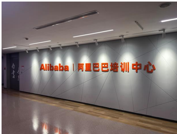
알리바바 그룹 본사 캠퍼스 탐방