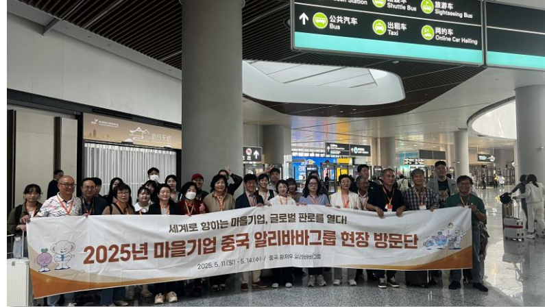
항저우 공항 도착