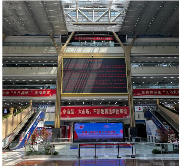
세계 최대 오프라인 도매시장 탐방