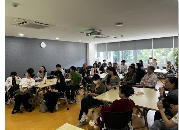
알리바바 Binjiang 캠퍼스 도착 및 조별 구성