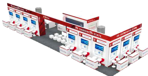
[25년도 부스 디자인]