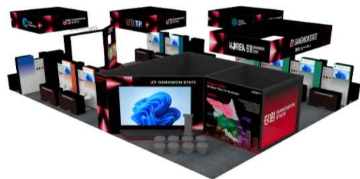
[26년도 부스 디자인]