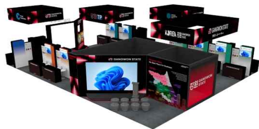
[26년도 부스 디자인]